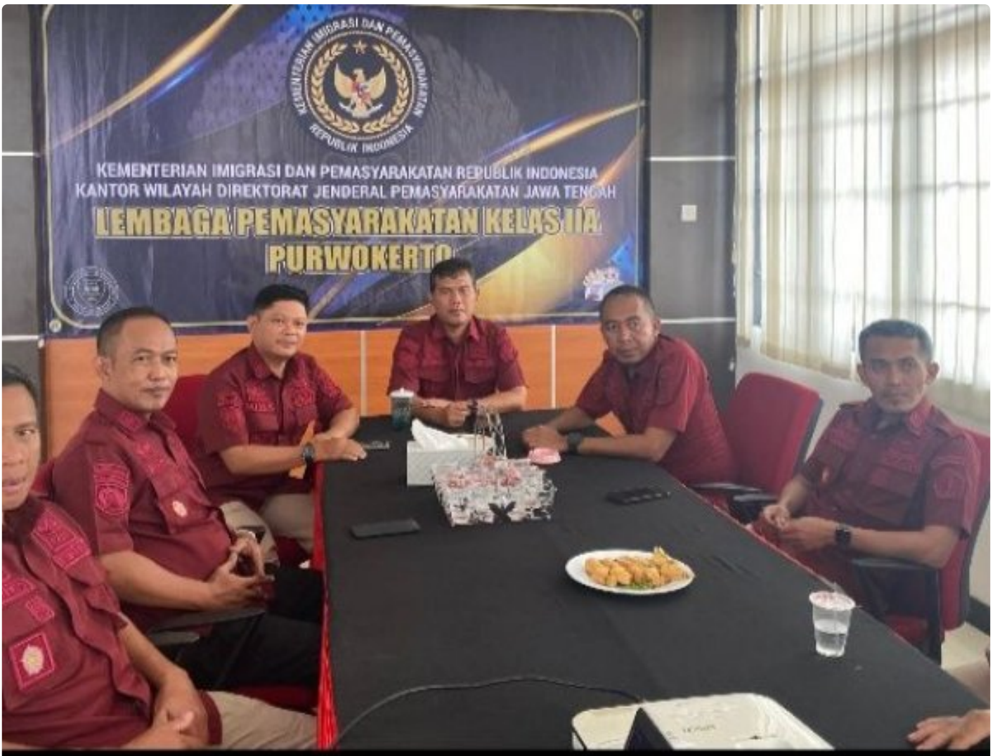
Lapas Purwokerto Ikuti Penguatan Kehumasan terkait Etika Penggunaan Media Sosial

PURWOKERTO Lembaga Pemasyarakatan (Lapas) Kelas IIA Purwokerto Mengikuti Secara Virtual Penguatan Kehumasan terkait Etika Penggunaan Media